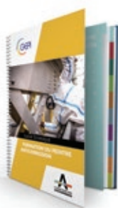
GUIDE DU PEINTRE