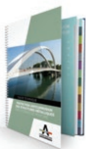
GUIDE DE L'ANTICORROSION