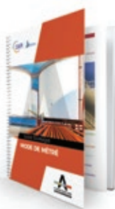
GUIDE MODE DE MÉTRÉ