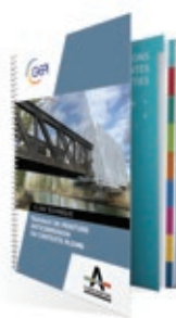
GUIDE DU PLOMB